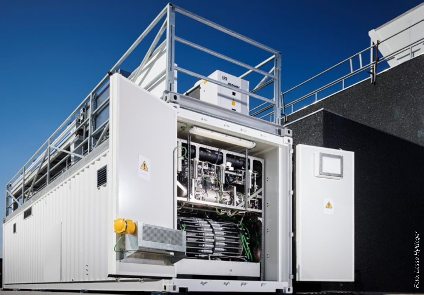
Containeren her indeholder et elektrolyseanlæg der kan omdanne vand til brint.