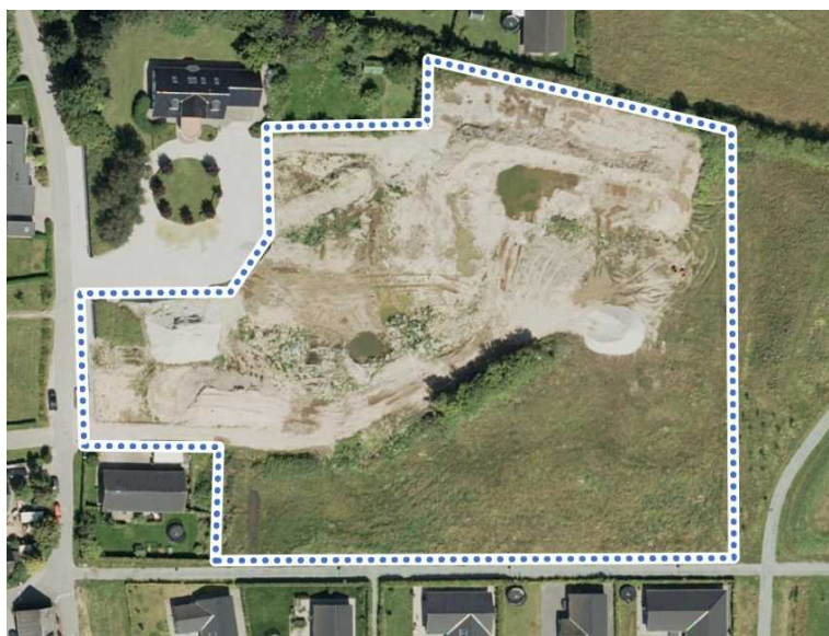
Figur 1: Markeringen viser spildevandsplantillæggets afgrænsning af området.

Regnvand vil håndteres i jordledninger og forventes ledt til et eksisterende regnvandsbassin, der er placeret på matrikel nr. 8z, Nr. Bjert By, Nr. Bjert.