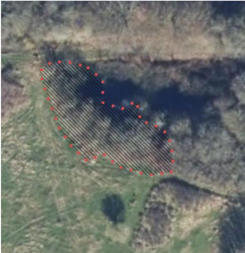
Figur 4 område hvor man vil tynde ud i træer.