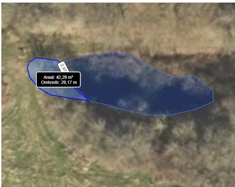
Figur 3 Nordlige sø med udvidelsen.

Da der skal graves i overdrevet og søen for at kunne udjævne brinkerne og vandspejlet og træer tyndes, kræver dette en § 3-dispensation. For detaljer, se figur 3 og 4.