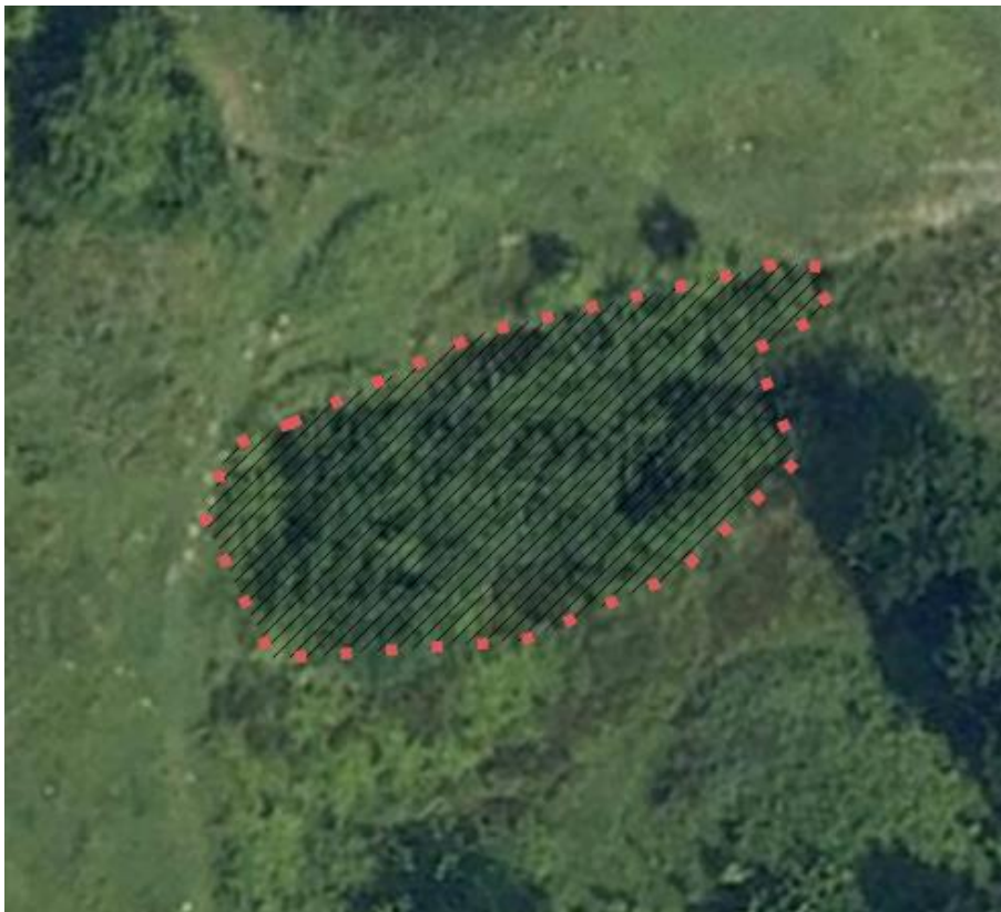
Figur 6 område hvor man vil tynde i træerne