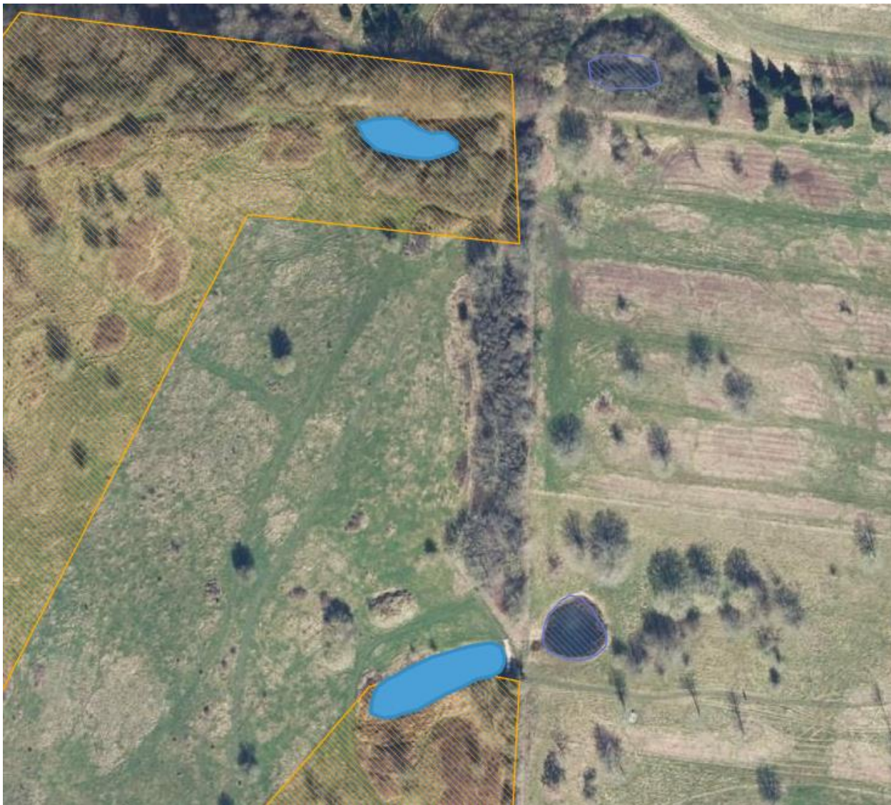
Figur 2 Billede over matr.nr. 24 Binderup By, Sdr. Bjert, hvor de to søer ligger