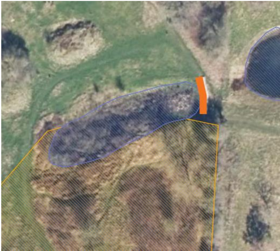
Figur 5 Den sydlige sø, hvor den orange streg er området hvor bredden hæves.