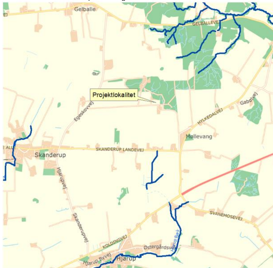
Figur 1: Oversigtskort.

Lokaliteten er markeret på oversigtskortet herunder.