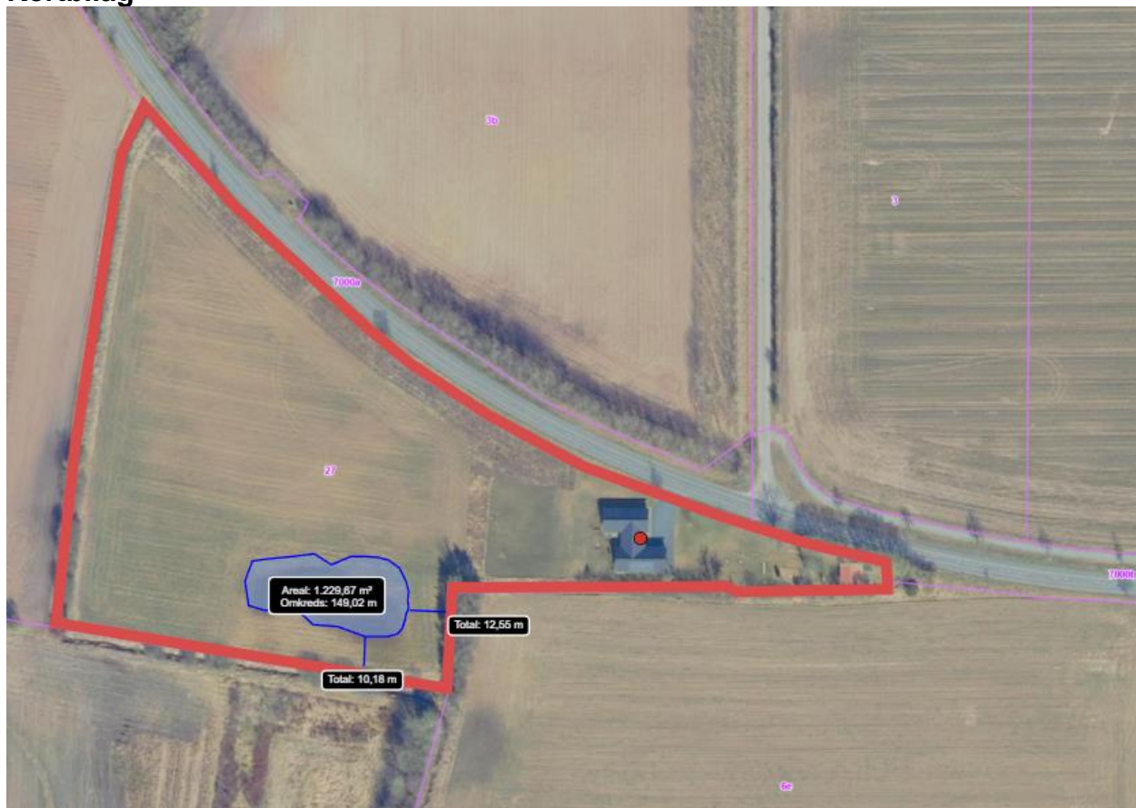
Kortbilag 1. Kort over hvor søen ønskes placeret på matrikel, med afstand til matrikelstel og vandløb, samt størrelse på søen. Gennemsigtig polygon med blå kant = placering af sø, rød kant = matrikelstel, mørkeblå streger = afstand fra matrikelstel og vandløb til søens kronekant.