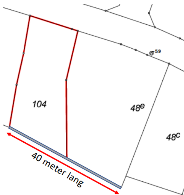
Figur 1. Matrikelkort med den eksisterende kystbeskyttelse indtegnet med en grå streg. Den ansøgte betonmur og stenkastning etableres med samme linjeføring.

Den nuværende kystbeskyttelse er placeret i skel, som markeret med den grå streg på Figur 1. Linjeføringen ændres ikke for den ansøgte kystbeskyttelse.