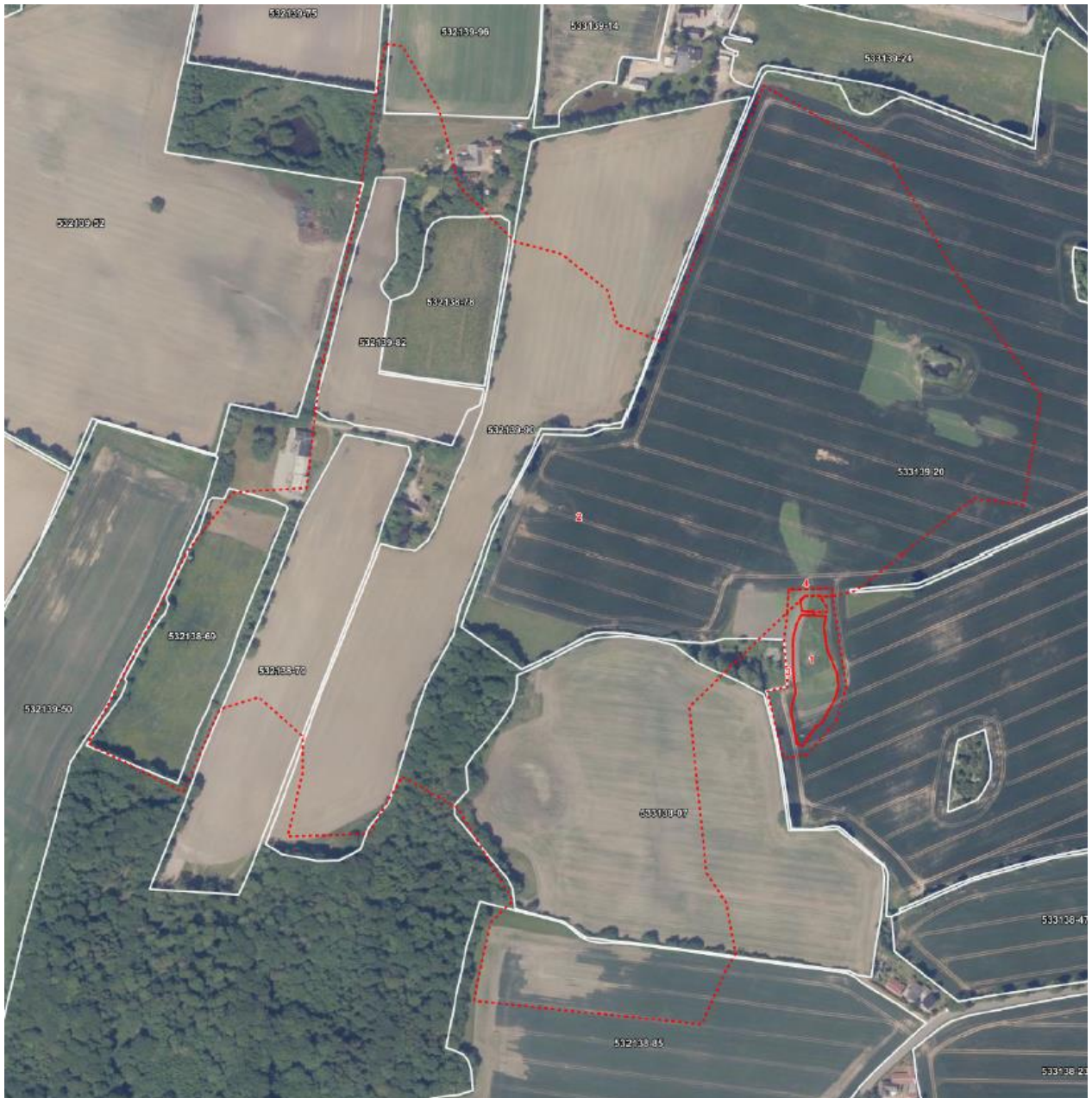
På luffotoet er drænolandet vist med en rød stiplede linje.