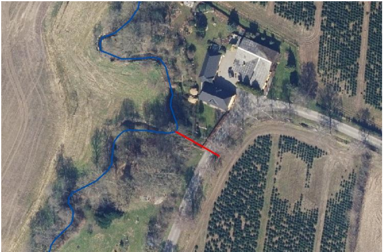
Figur 1: Den røde linje angiver den omtrentlige placering af eksisterende rørlagte vandløb som skiftes. Brønden etableres på østsiden af Kokærvej i skel mod plantagen.