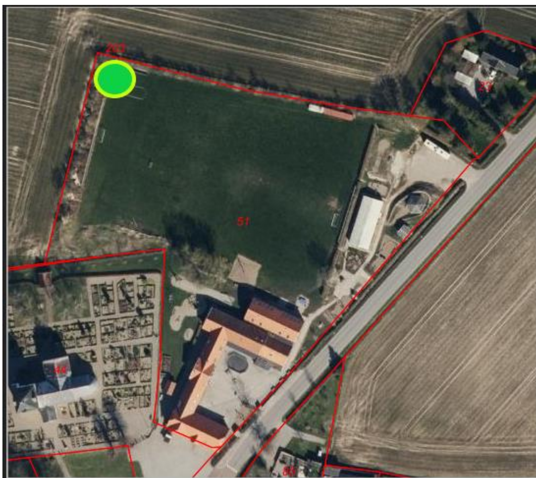
Situationsplan jf. ansøgningen – madpakkehuset markeret med grøn

Aller Friskole har ansøgt om at opføre et madpakkehus på ca. 50 m 2 til brug for skolens elever. Madpakkehuset placeres ca. 100 meter nordvest for skolen på et grønt areal ved Aller Friskole. Bygningshøjden bliver maksimal 3,6 meter. Taget beklædes med grønt sedumtag og sider beklædes med rå lærkeplanker. Bygningen bliver møbleret med bord/bænke sæt, og skal fungere som madpakkehus samt udendørs aktiviteter som eks læring om dyr, rensning af fisk m.m. Hyttens formål er alene at give læ og tørvejr til de ting børnene laver udendørs, men hvor der bliver mulighed for at udføre disse aktiviteter under tag. På siderne vil der blive monteret rammer med plexiglas over stakit, som kan afmonteres forår og sommer.