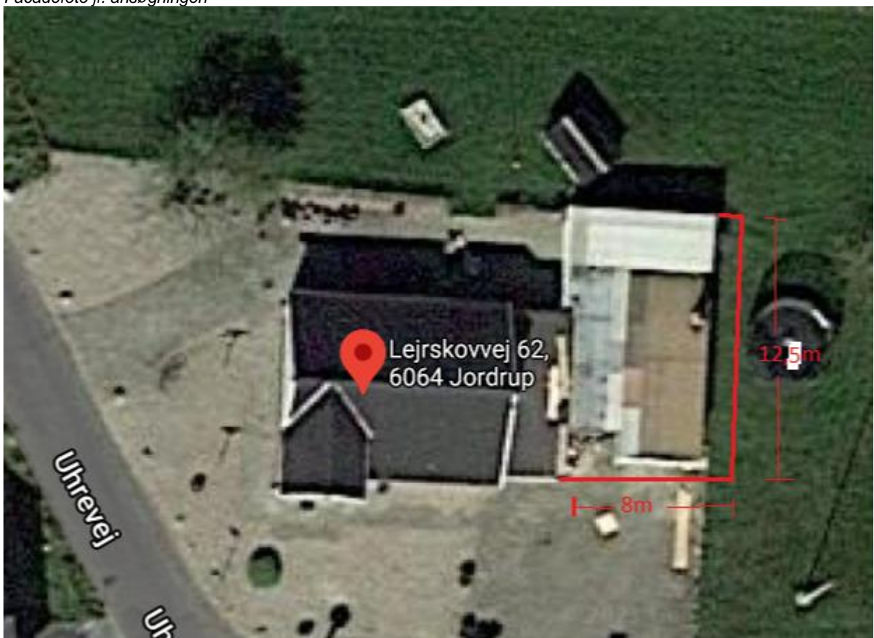
Situationsplan jf. ansøgningen

Ejendommen har en samlet størrelse på 3.102 m 2 og er ikke omfattet af landbrugspligt.