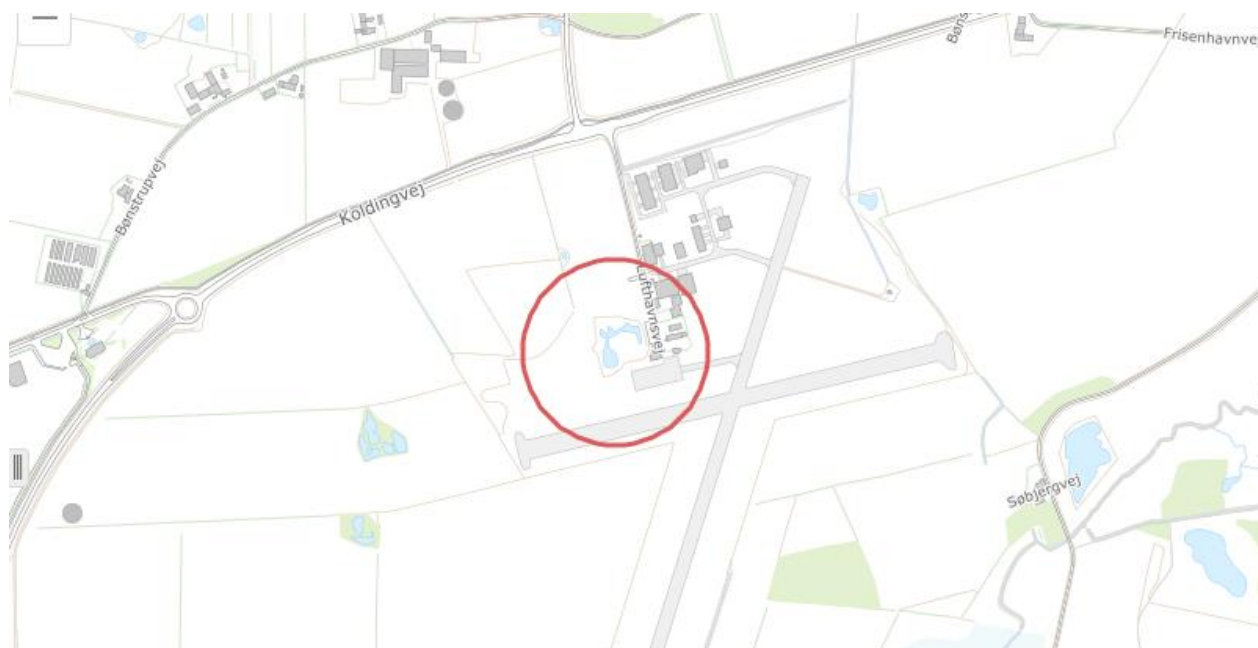
Figur 1: Oversigtskort over området nær Kolding Lufthavn. Søen, hvis afløb reguleres er markeret med en rød ring.