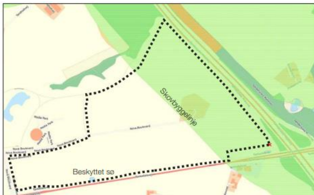
Lokalplan 0831-33 (sort stiple) og området omfattet af skovbyggelinjen (lys grøn) Skoven ligger øst for motorvejen (mørk grøn og orange). Illustration fra lokalplanen.

Det fremgår af lokalplanen, at "Der må - uanset lokalplanens bestemmelser - ikke placeres bebyggelse, campingvogne og lignende inden for skovbyggelinjen jf. naturbeskyttelseslovens § 17, før beskyttelseslinjen er ophævet af Miljøstyrelsen, med mindre der gives dispensation af kommunen i hvert enkelt tilfælde."