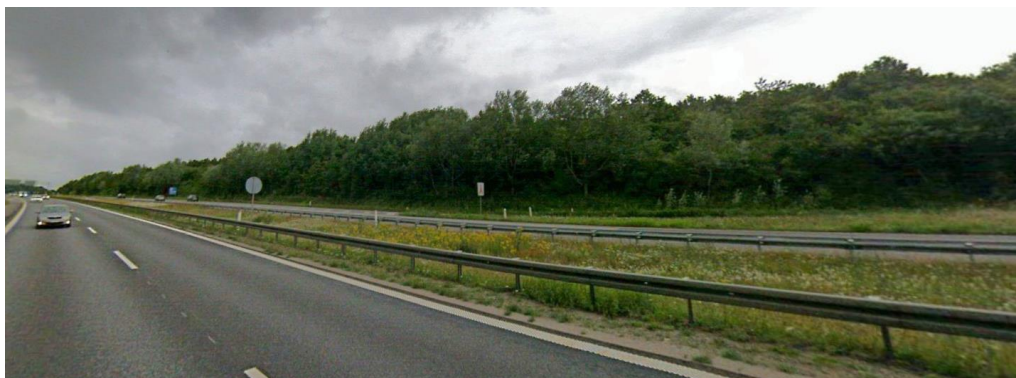
Skoven/ skovbrynet set fra motorvej E45.