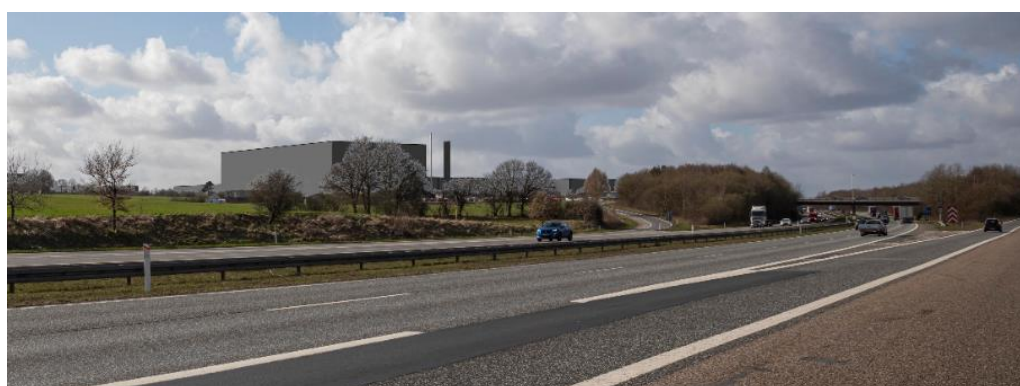
Udsnit af visualisering set fra syd (fra motorvej E45) af den maksimale udnyttelse af lokalplanens byggemuligheder. Skoven med den pågældende skovbyggelinje ligger på højre side af motorvejen, efter motorvejsbroen. Byggeriet der søges dispensation svarer (maksimalt) til bygningerne til højre for det markante højlager. I midten af billedet er illustreret en reklamepylon, som siden er taget ud af lokalplanen. Illustration fra miljørapport for tillæg til kommuneplanen.

Skoven ligger øst for motorvej E45 (på den modsatte side af motorvejen end det ansøgte byggeri) på en del af matr. 5e Seest By, Seest. E45. På den pågældende strækning er skoven kun cirka 40 meter bred. Skoven/ skovbrynet har ikke i sig selv stor landskabelig herlighedsværdi, men har karakter af et bredt plantebælte og bidrager væsentligt til en begrønning af motorvejen omkring Kolding.