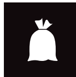
Restaffald / Residual waste / Restmüll