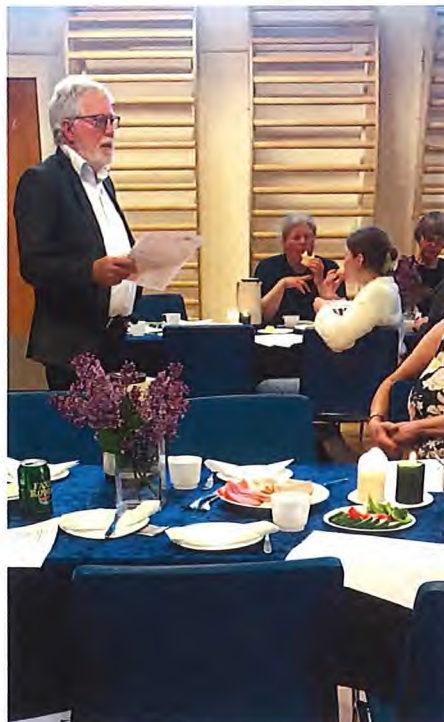
Idémøde på Aller Friskole.