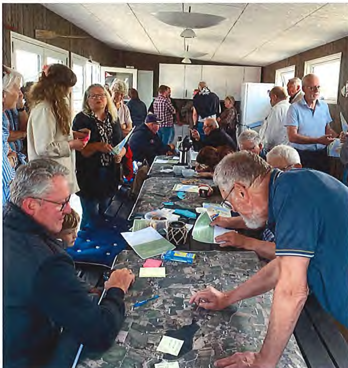
Idémøde i Hejlsminde forsamlingshus.