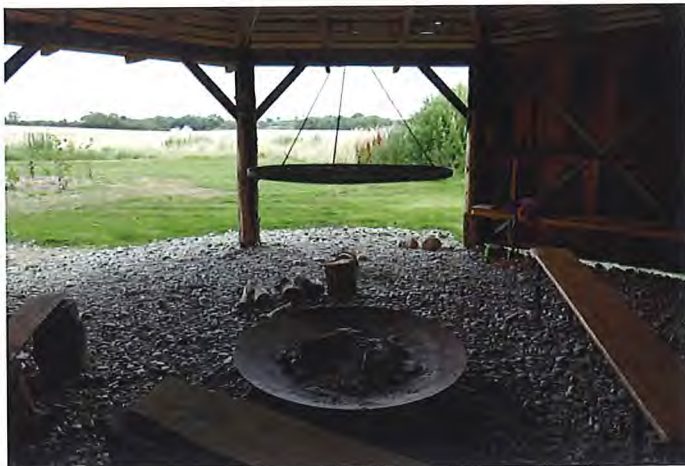
Det er populært at gå til spejder i Hejls.