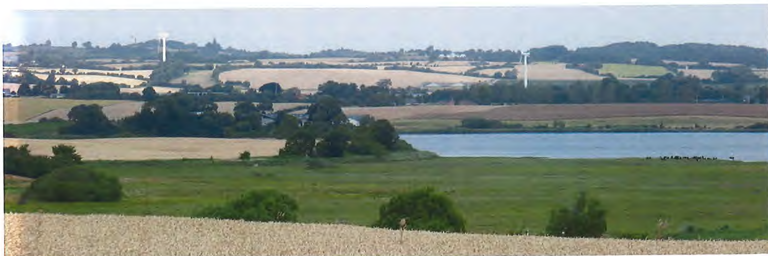
Sydskråningen set fra Hejlsminde Nor med Skamlingsbanken i baggrunden.

Der var frem til 1948 jernbane fra Kolding til Hejls og Hejlsminde.