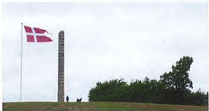
Skamlingsbanken er kendt landet over for sin historie og sin flotte udsigt.

Skamlingsbanken er med sine 113 meter Sønderjyllands højeste punkt og er med sin historiske betydning kendt landet over og forbindes med det at være dansk og den levende samfundsdebat. Det nye besøgscenter er flot indpasset i landskabet og er endnu en grund til at besøge området. Om sommeren er operæen i bakkerne en stor succes.