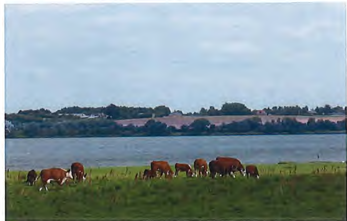
Hejlsminde Nor er et internationalt beskyttet naturområde af høj klasse.