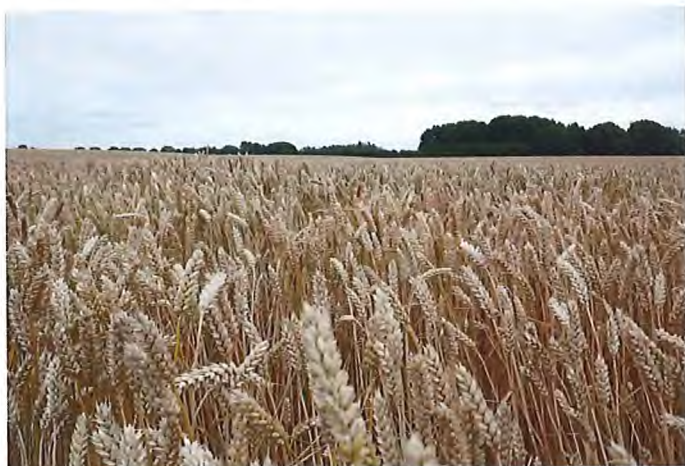
Kornet står flot på områdets frugtbare landbrugsjord.

I den modsatte ende af området er Noret sammen med Lillebælt et righoldigt naturområde af international klasse. Naturpark Lillebælt er landets største naturpark udpeget af Friluftsrådet, og Lillebælt indgår nu i den nye Marine Naturnationalpark Lillebælt, som Miljøministeriet står bag