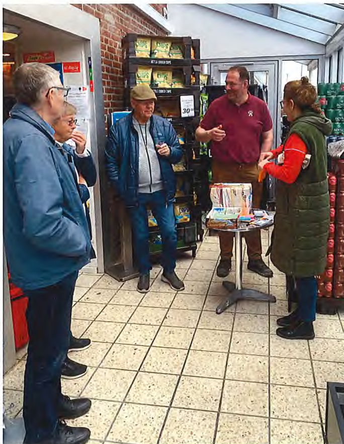
Idémøde i Dagli'Brugsen i Sjølund.