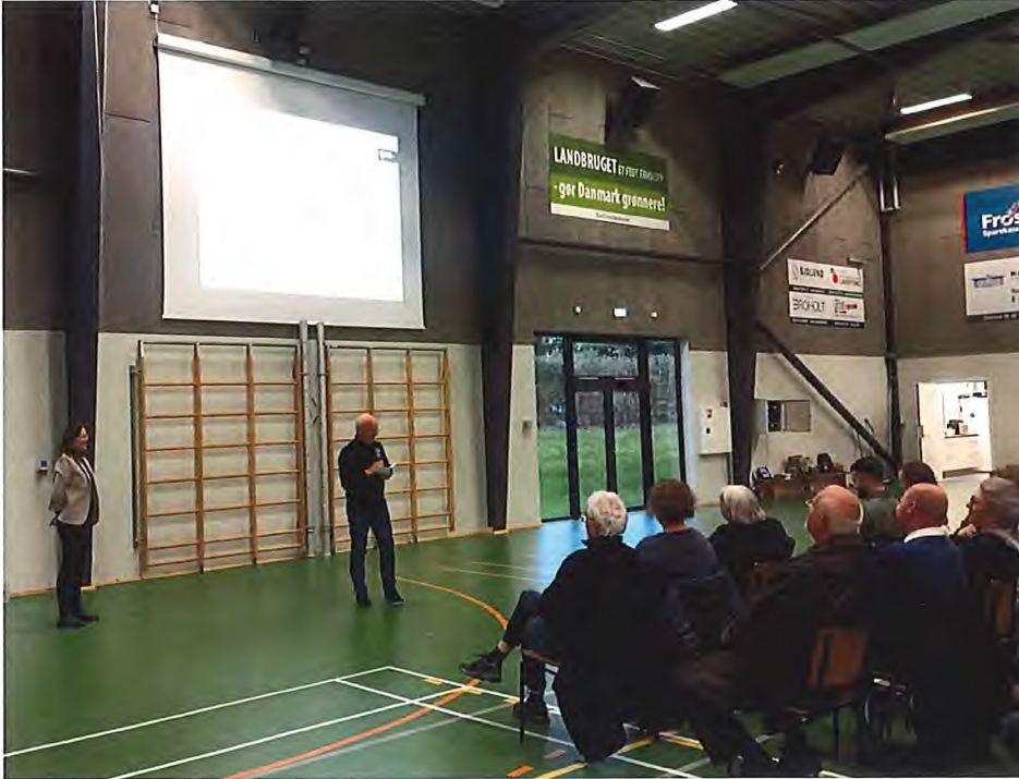
Afsluttende præsentations- og debatmøde i Multiarenaen i Sjølund.