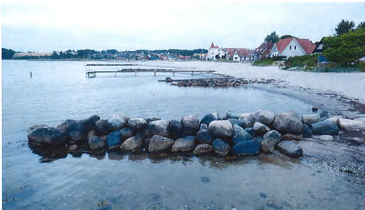
Hejlsminde Strand er et populært feriested.