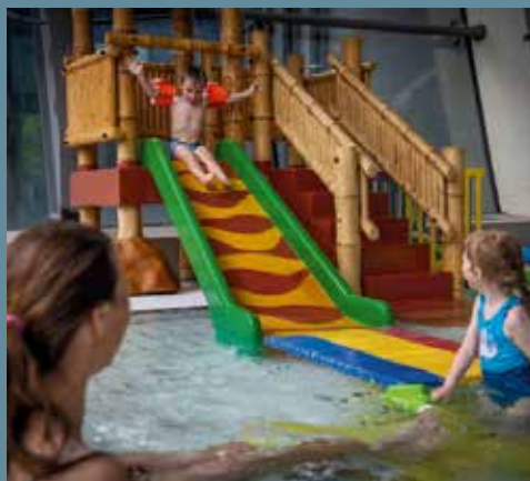
Leg for de små