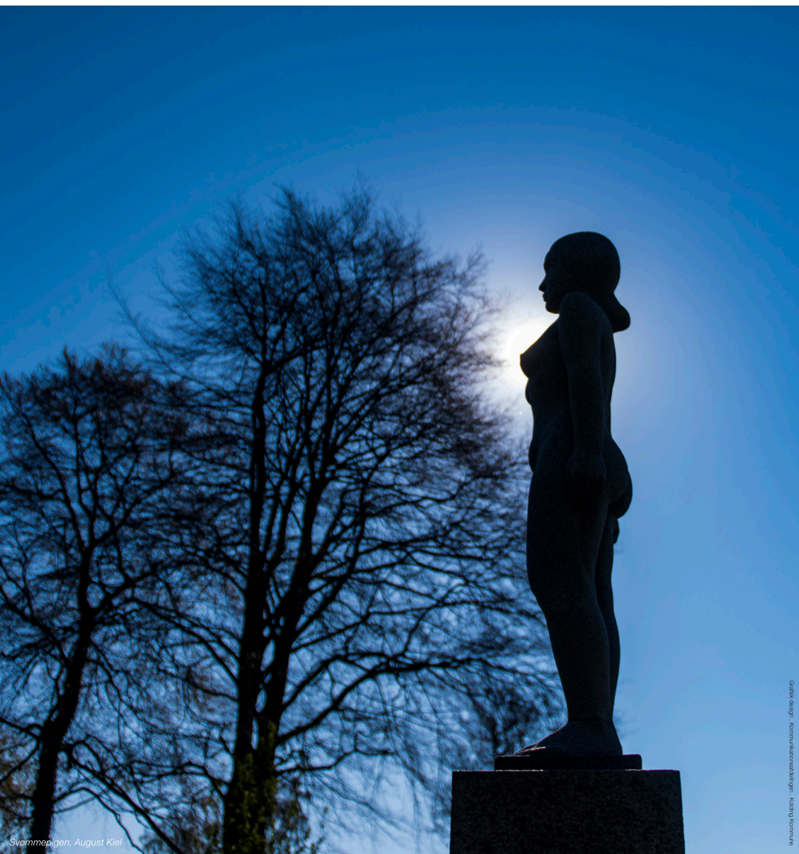
Svømmepigen, August Kiel