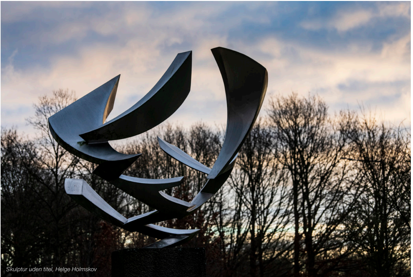
Skulptur uden titel, Helge Holmskov