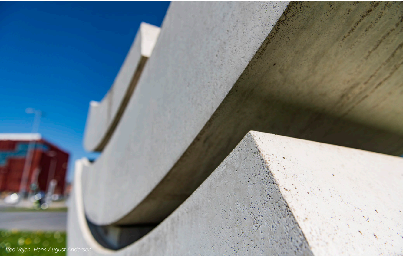
Ved Vejen, Hans August Andersen