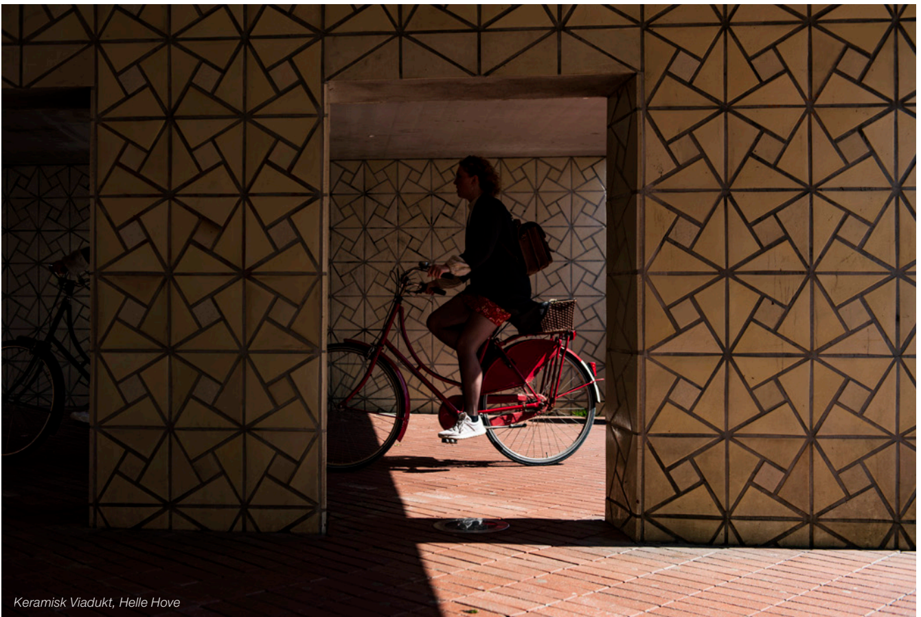
Keramisk Viadukt, Helle Hove