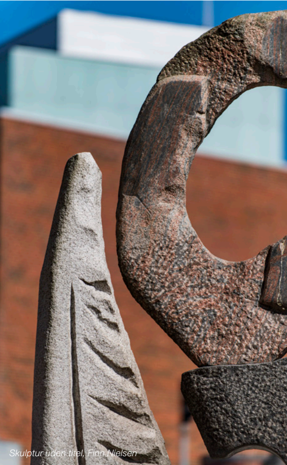
Skulptur uden titel, Finn Nielsen